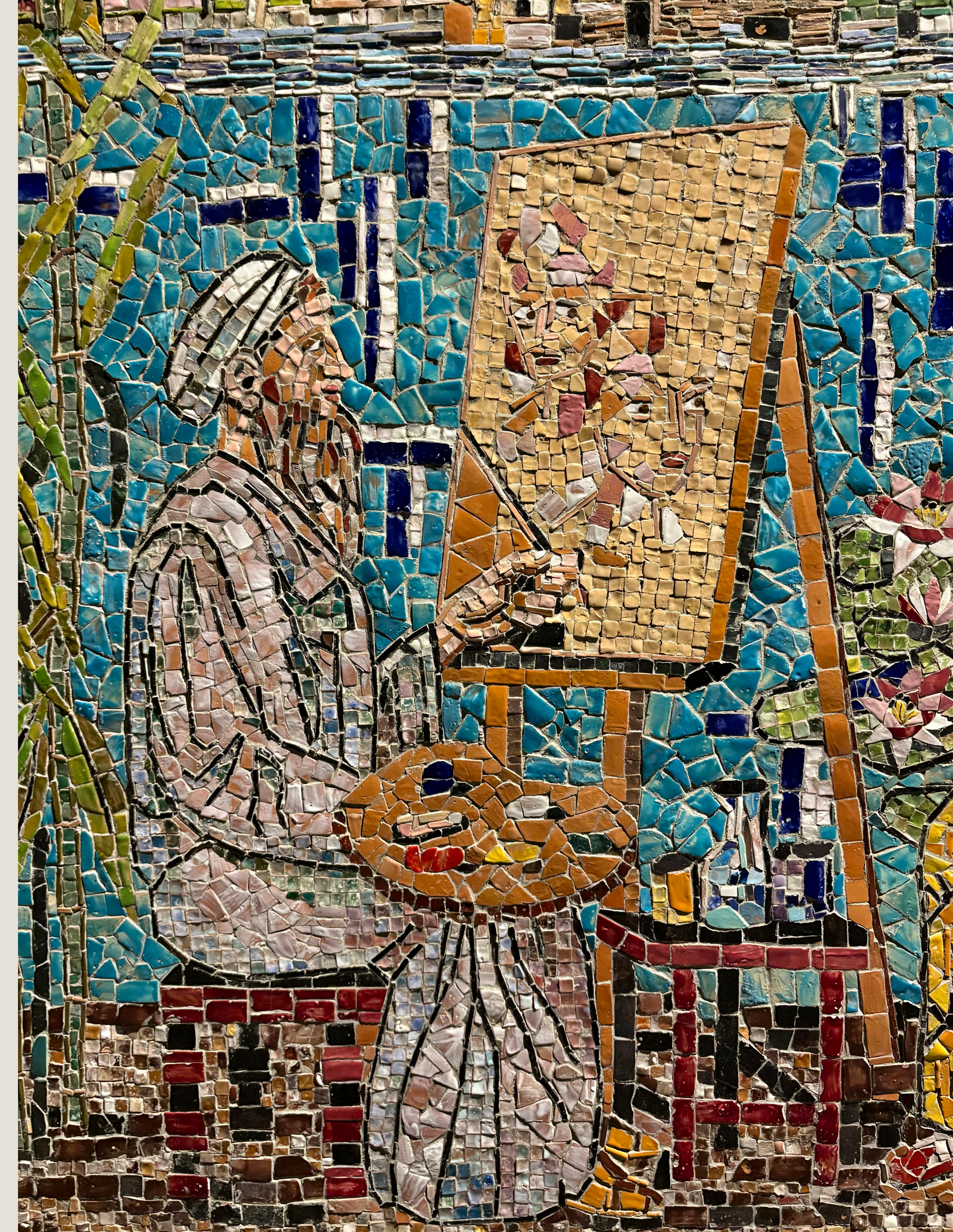
Mosaik-Kunstwerk in Blevio.

Ein Highlight ist die Bootsfahrt von Cernobbio nach Blevio, einem Künstlerdorf auf der gegenüberliegenden Seeseite. Bei einem Rundgang entdecken wir Mosaik-Kunstwerke der dort lebenden Künstler und besuchen ausgewählte Ateliers. Anschließend halten wir unsere Eindrücke bei italienischen Köstlichkeiten schriftlich oder gestaltend fest. Ein Halbtagesausflug führt uns nach Como. Beim Schlendern durch die Altstadt und Besuch des Doms lassen wir uns von der faszinierenden Stadt inspirieren und bringen diese Eindrücke kreativ zu Papier.